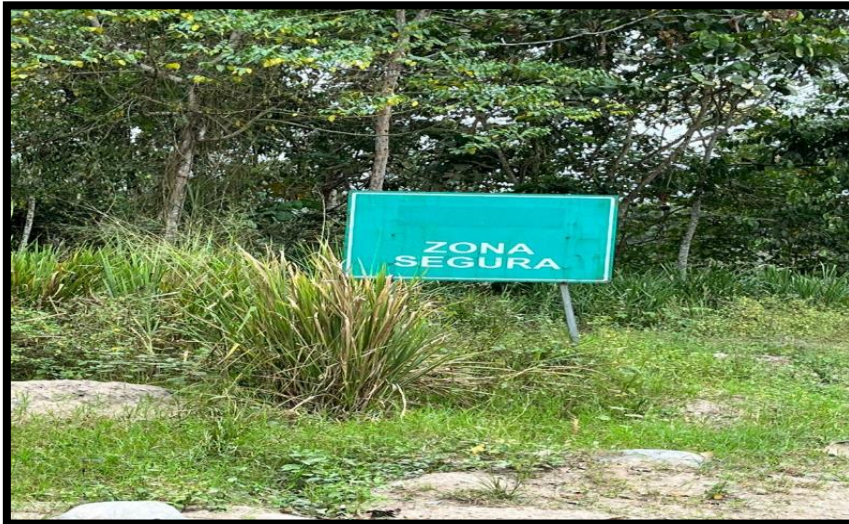
Ilustración 5. Área segura en caso de Emergencia.