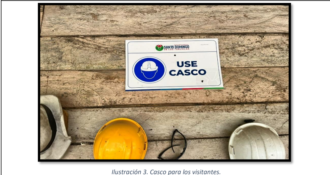
Ilustración 3. Casco para los visitantes.