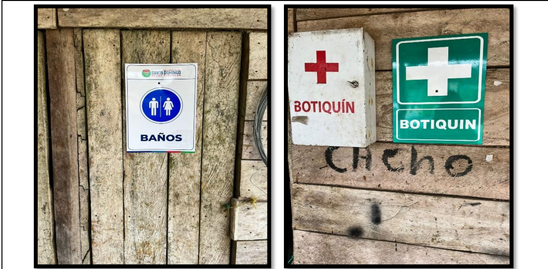
Ilustración 2. Caseta con baño y Botiquin de Primeros Auxilios.