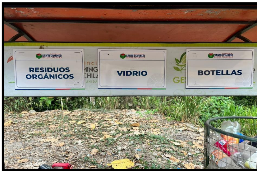
Ilustración 4. Señalética para la Clasificación de los desechos.