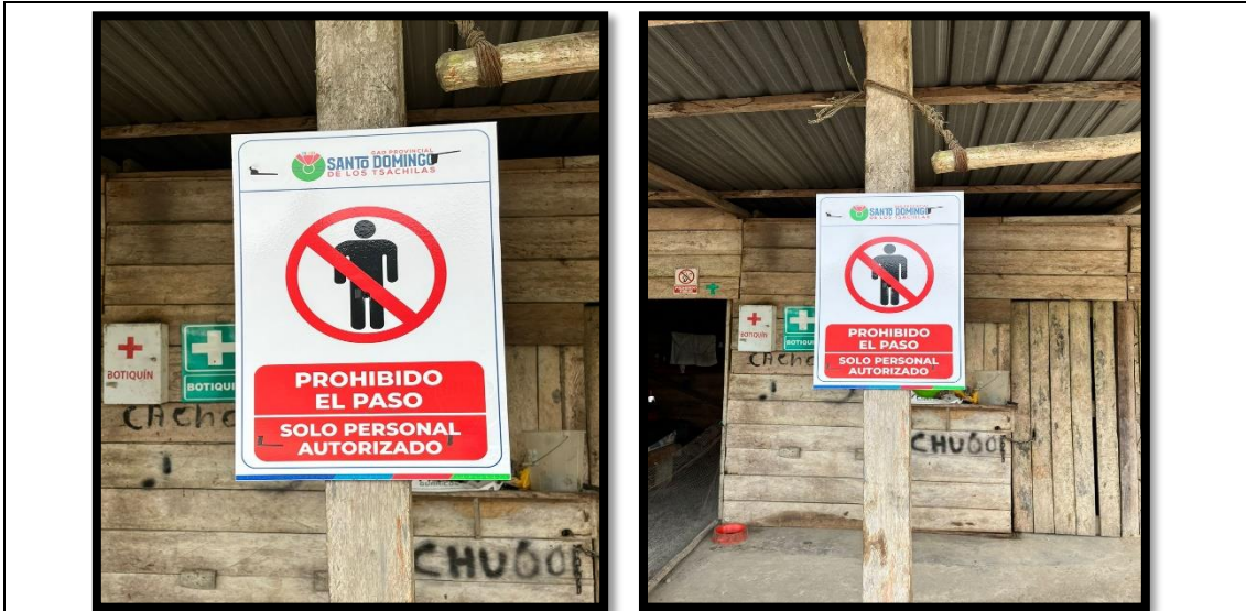
Ilustración 1. Caseta de Guardia