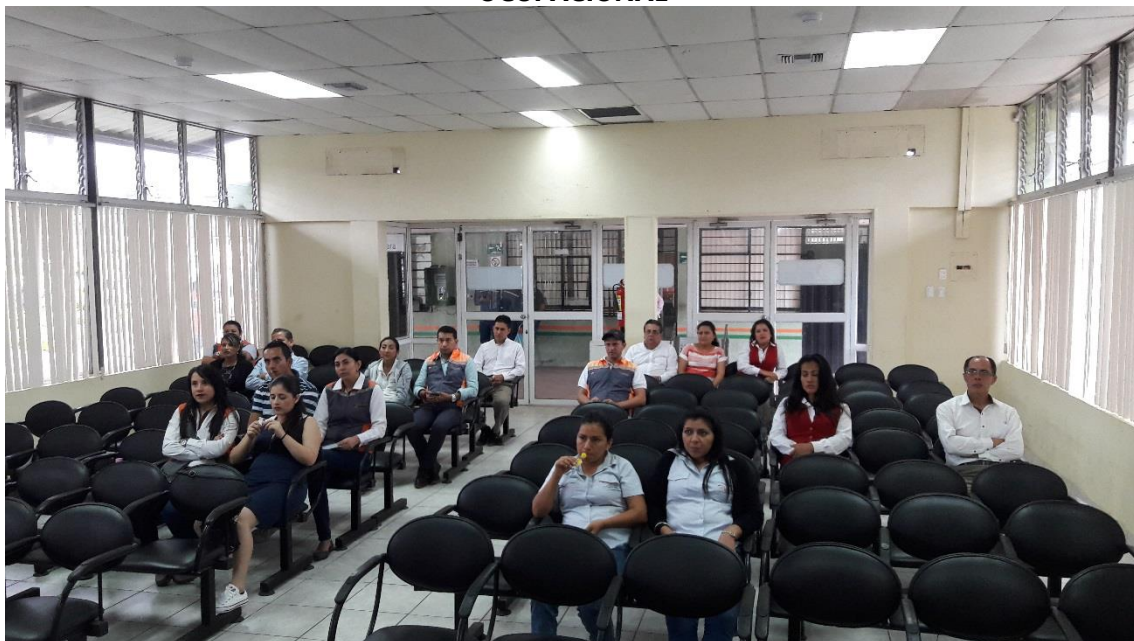
EJERCICIOS DE PAUSAS ACTIVAS