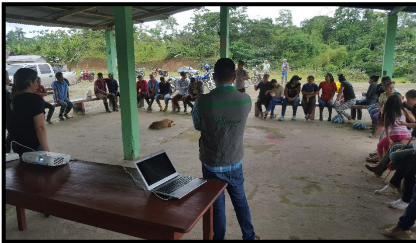
Anexo 4. Se presenta el Informe Ambiental de Cumplimiento del proyecto periodo julio 2015 - julio 2016.