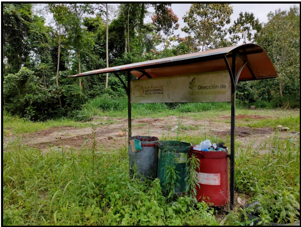
Ilustración 2. Contenedores para la clasificación de los Desechos Sólidos comunes